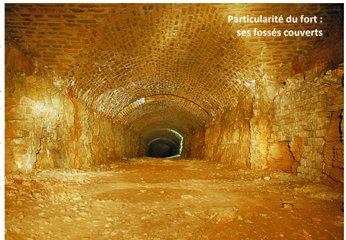
Particularité du fort : ses fossés couverts

Le fort de la Bonnelle est l'un des rares ouvrages langrois à avoir engagé un duel d'artillerie avec les troupes prussiennes en novembre 1870.